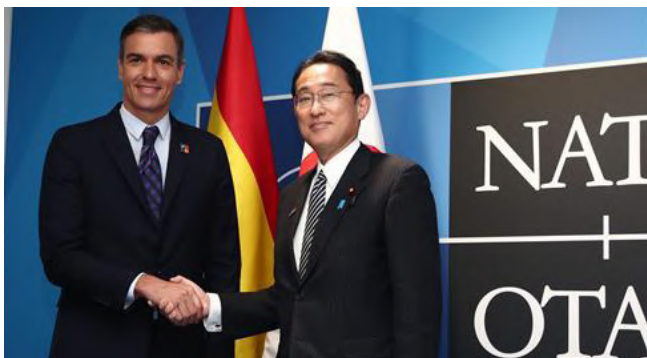
El primer ministro japonés Kishida junto al presidente español Sánchez.- Madrid 29-30 de junio de 2022.-Foto: Pool Moncloa/Fernando Calvo