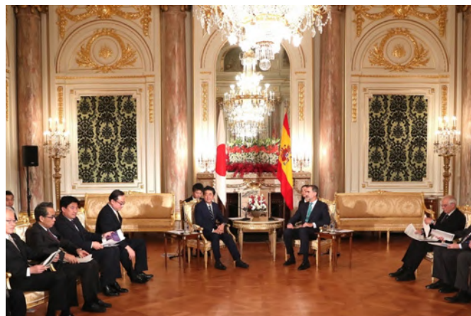
Su Majestad el Rey durante el encuentro que mantuvo con el anterior primer ministro de Japón, Sr. Shinzo Abe, en el Palacio de Akasaka. Tokio (Japón), 21.10.2019.

Japón ve en Corea del Norte una amenaza por su potencial nuclear y balístico. A ello se suma la cuestión no resuelta de los secuestros de japoneses en los 70' y 80' por el régimen norcoreano.