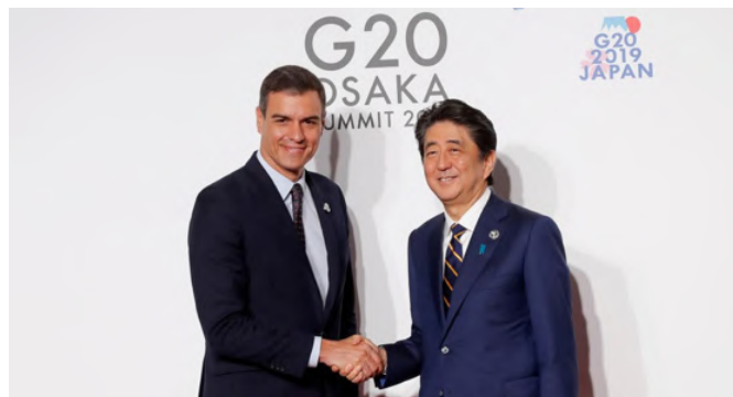
Encuentro del presidente Pedro Sánchez con el anterior primer ministro japonés Shinzo Abe, durante la celebración en Osaka el día 28 de junio 2019 en los márgenes de la Cumbre del G-20.