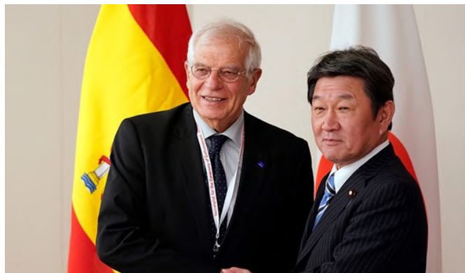
Encuentro entre el anterior ministro de Asuntos Exteriores de España, Josep Borrell y el entonces ministro de Asuntos Exteriores de Japón, Toshimitsu Motegi, antes de una reunión en el Ministerio de Asuntos Exteriores en Tokio.- 21 de octubre de 2019.

En 2002 fue nombrado Director General de la Agencia de Defensa en el primer Gabinete de Koizumi y en 2007 Ministro Defensa en el Gabinete